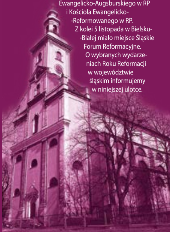
Kościół Jezusowy w Cieszynie

500 lat temu, 31 października 1517 roku Marcin Luter, ogłaszając w Wittenberdze 95 tez przeciwko praktyce odpustów, dał początek Reformacji. Sejmik Województwa Śląskiego postanowił upamiętnić tę rocznicę i ogłosił rok 2017 Rokiem Reformacji. Ogólnopolska Inauguracja Obchodów Jubileuszu 500 lat Reformacji miała miejsce 31 października 2016 roku w kościele Jezusowym w Cieszynie. Kilkanaście dni wcześniej (15 października) również w Cieszynie odbyła się uroczysta wspólna sesja obrad Synodów Kościoła Ewangelicko-Augsburskiego w RP i Kościoła Ewangelicko-Reformowanego w RP. Z kolei 5 listopada w Bielsku-Białej miało miejsce Śląskie Forum Reformacyjne. O wybranych wydarzeniach Roku Reformacji w województwie śląskim informujemy w niniejszej ulotce.