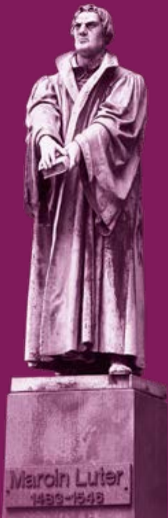
Pomnik Marcina Lutra w Bielsku-Białej