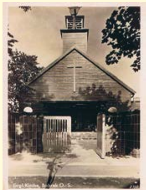
Kościół w Bobrku

Org.: Muzeum Górnośląski Park Etnograficzny w Chorzowie